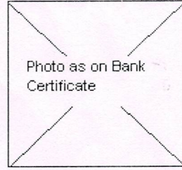
AJIT SURYAKANT RAJDEV PROPRIETOR